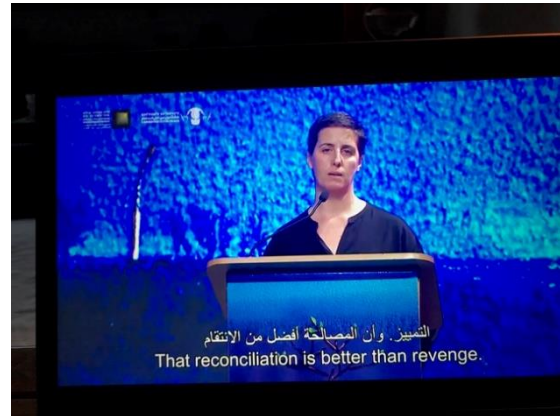
Friedens Initiativen Combatant of Peace und Bereaved Families

Wegen Corona, konnte das Retreat in Israel und Palästina nicht durchgeführt werden. Wir hoffen, dass es im nächsten Jahr klappen wird.