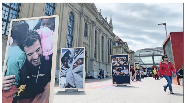
Ausstellung am Bahnhofplatz

Am 20.-21. Juni über die ganze Nacht, werden wir als Zen Peacemaker am Flüchtlingstag in Bern mit-helfen. Ausser der Ausstellung, dem Namenlesen von rund 35 Tausend Menschen, und den Zetteln an der Fassade der Kirche wo letztes Jahr gegen 25'000 Namen hingen, sollen dieses Jahr noch 38'739 handgeschriebene Briefe an den Bundesrat bis 30. Juni geschickt werden.