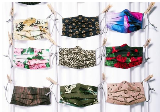
Maskenangebot im Internet

Aber Spiritualität und Covid hat für mich insofern einen Zusammenhang, dass Covid sehr Vieles sichtbar gemacht hat, schon nur durch den Umstand, dass viel weniger Konsum und Ablenkung da ist. Ich habe mir auch vorgenommen, die großen Sportevents nicht mehr so ans Herz zu nehmen, denn ich bin eigentlich auch ein Fußballfan. Als Ablenkung von meiner geistigen Unruhe ist es letztlich nicht nachhaltig befriedigend, sondern eher unbefriedigend. Die Meditation befriedigt mich viel mehr und bringt mich näher zu mir selber und zum Du. Covid zeigt uns, wie die Konsumgesellschaft antreibt, uns am Laufen hält, was gar nicht nötig ist, aber uns von uns selber wegbringt. Viele glauben, diese Ablenkung sei das was uns glücklich macht, doch im Grunde genommen habe ich durch die spirituelle Erfahrung die Gewissheit bekommen, dass es gerade umgekehrt ist. Die Ablenkungen machen mich nicht glücklicher, sie bringen mich eher von meinem inneren ruhigeren und ausgeglichenen Wesen weg. Wohl deshalb habe ich immer wieder das Bedürfnis mich hinzusetzen und zu meditieren.