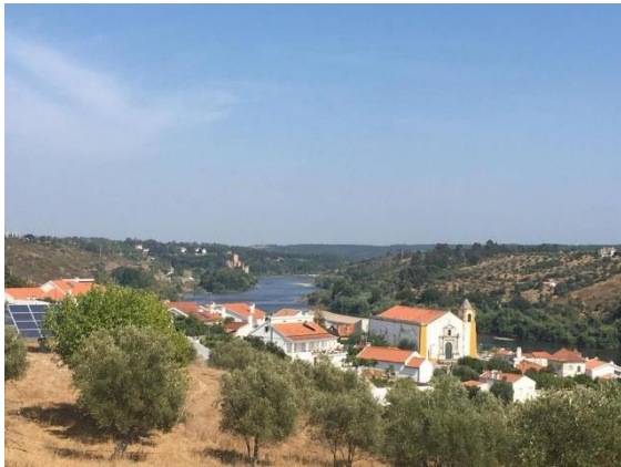
Aussicht von Togeikko-ji: Tancos und der Tejo

Vielleicht bei Vollmond, wo wir den Hasen im Mond sehen können, wie es die alte ostasiatische Legende erzählt. Derselbe Mond, bei dem wir unsere Bodhisattva-Gelübde immer wieder erneuern, das Licht mitten in der Dunkelheit der Nacht. Vielleicht wurde auch da der Traum vom Togeikko-ji – Templo Luar do Coelho (Tempel Mondschein des Hasen) - geboren.