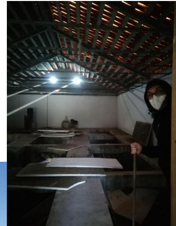
Der Umbau im Haus der Kaninchenzucht

Und von nun an können wir anfangen, diesen Traum „Mondschein des Hasen“ zu teilen, denn er ist ein kollektives Werk. In diesem Moment ist eine große Samu-Bewegung notwendig: Wir haben alle Hände voll zu tun um das Zentrum vorzubereiten, das soziale Netzwerk zu erweitern und das Projekt so aufzustellen, dass eine Finanzierung durch Spenden für die Bauphase organisiert werden kann. Das Grundkonzept ist ein Projekt, das sich später mit eigenen Mitteln aus dem, was es erwirtschaftet wird, selbst tragen kann. Wenn man aus dem Traum erwacht, ist es an der Zeit zu erkennen und zu tun, was getan werden muss, zum Wohle aller Wesen! Es sind alle herzlich eingeladen!